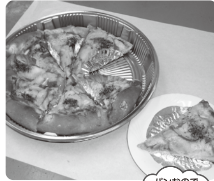
パンなので ふっくら しています。